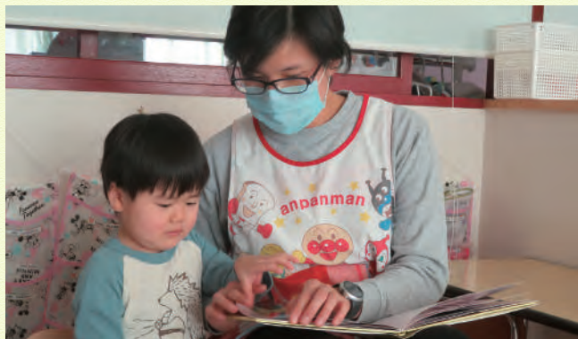
月に1回、先生とまるっと1日一緒に遊ぶ未満児さん