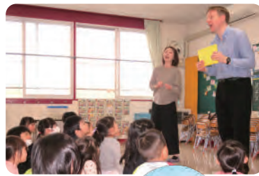
外国人講師の英語指導