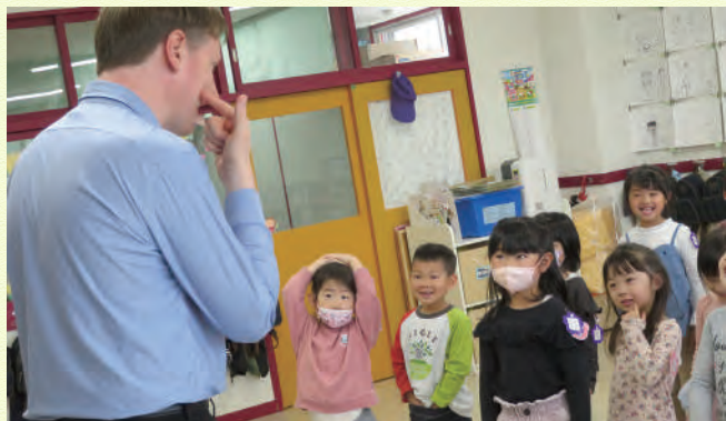
年間20回、しっかり英語が身につく年長さん