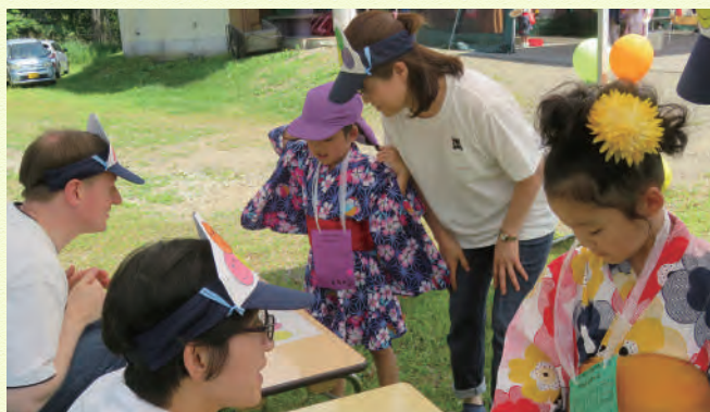
つつじ祭りに英語の出店登場